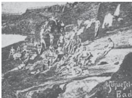
Um banho de sol na encosta do Monte Brasil