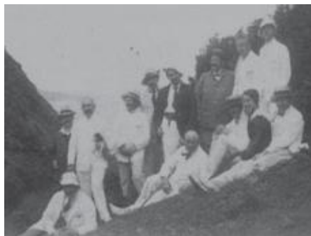
e um passeio pela Natureza do mesmo com uma faialense

ros, fogueiros, agricultores, desenhadores, marinheiros, empregados de hotel e outros. Entre eles, estabeleceu-se um tipo de grupos, de acordo com status diferentes, o que se refletia até no contato e atitude dos militares portugueses. Havia alguns a quem era mesmo permitido ter criadas, desde que as pudessem sustentar, o que obviamente quase não se verificou, mas estas podiam sair do depósito para fazer compras à cidade. 12