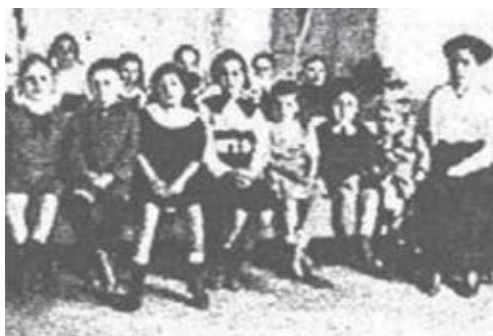
Escola de Crianças