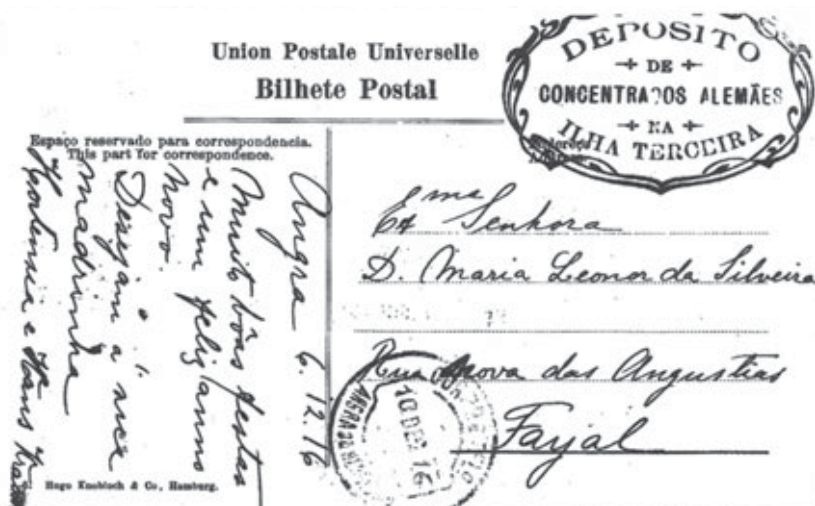
Verso de postal com o carimbo do DCA enviado à minha bisavó

cultura, horticultura, pesca, natação etc. 14 adaptando as instalações e os redu- tos, e aproveitando o espaço e a Natureza que os cercava no Monte Brasil. 15