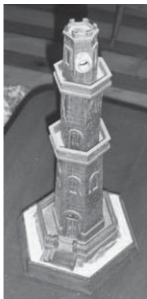
Farol de madeira eletrificado construído na DCA

Talvez, talvez não. Atente-se no entanto, que as condições em que ficaram a viver, passados os primeiros tempos de dificuldade, passaram a ser relativamente boas, para o que contribuiu a iniciativa e organização dos próprios internados: tendo dividido as grandes casamatas em panos dependurados em cordas conseguindo que os membros das famílias se mantivessem juntos e com um pouco mais de privacidade; organizavam-se atividades desportivas, recreativas, escola de crianças e de adultos, escola de violino e piano, uma orquestra, modelismo 13 , jardinagem, avi-