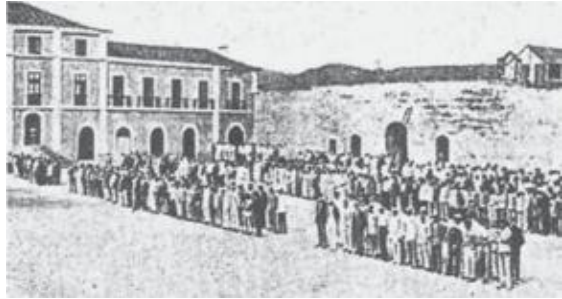
Passagem de revista aos prisioneiros

promontório do Monte Brasil, Angra do Heroísmo. 8 Aí se constituiu, o DEPÓSITO DE CONCENTRADOS ALEMÃES (DCA). Para o mesmo fim, e dada a localização do aprisionamento nas colónias, foram ainda constituídos campos em Macequece, Angola; na Beira, Moçambique; em Laudana na Guiné, e em Mormugão na Índia. Como campos