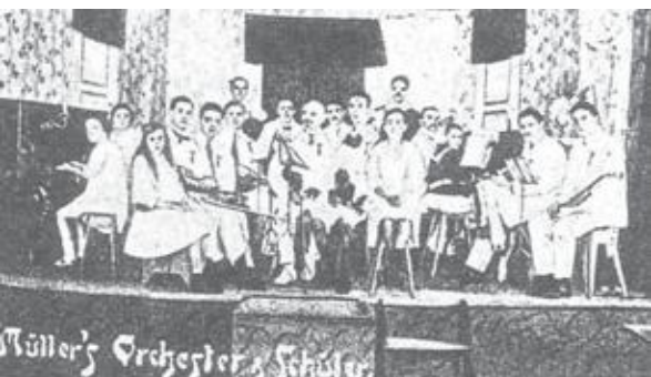
Orquestra com músicos e alunos

A situação foi ainda melhorando apesar da detenção ter durado mais de 3 anos e ter-se prolongado por 1 ano após a guerra ter terminado em 11.11.1918, por se aguardar as resoluções do Tratado de Versailles, assinado em 9.7.1919, pelo presidente da República Alemã, Friedrich Ebert.