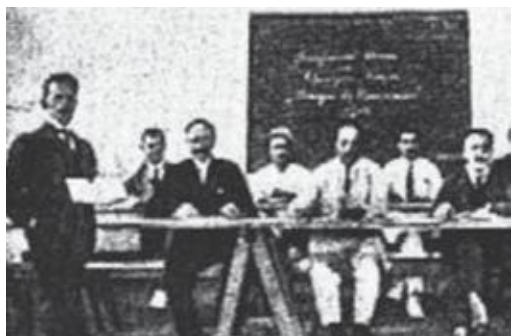
Escola de Adultos