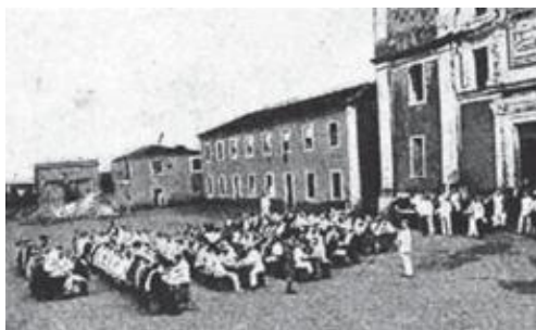
Refeição ao ar livre